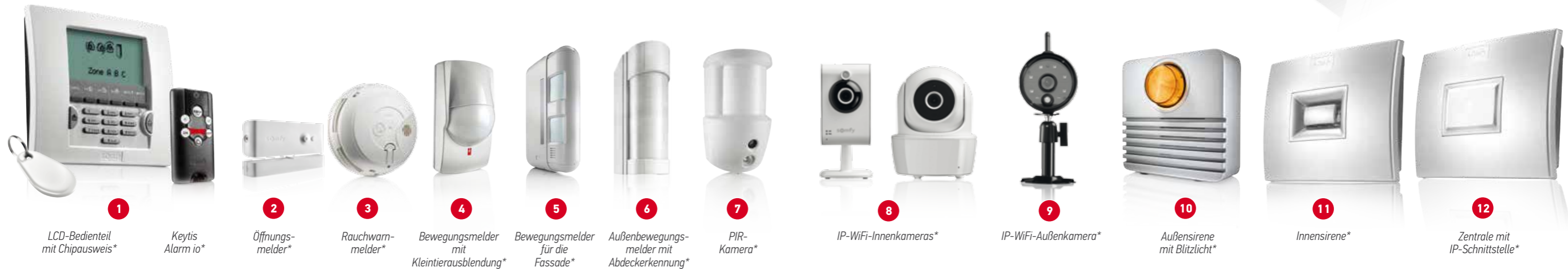
1 LCD-Bedienteil mit Chipausweis*